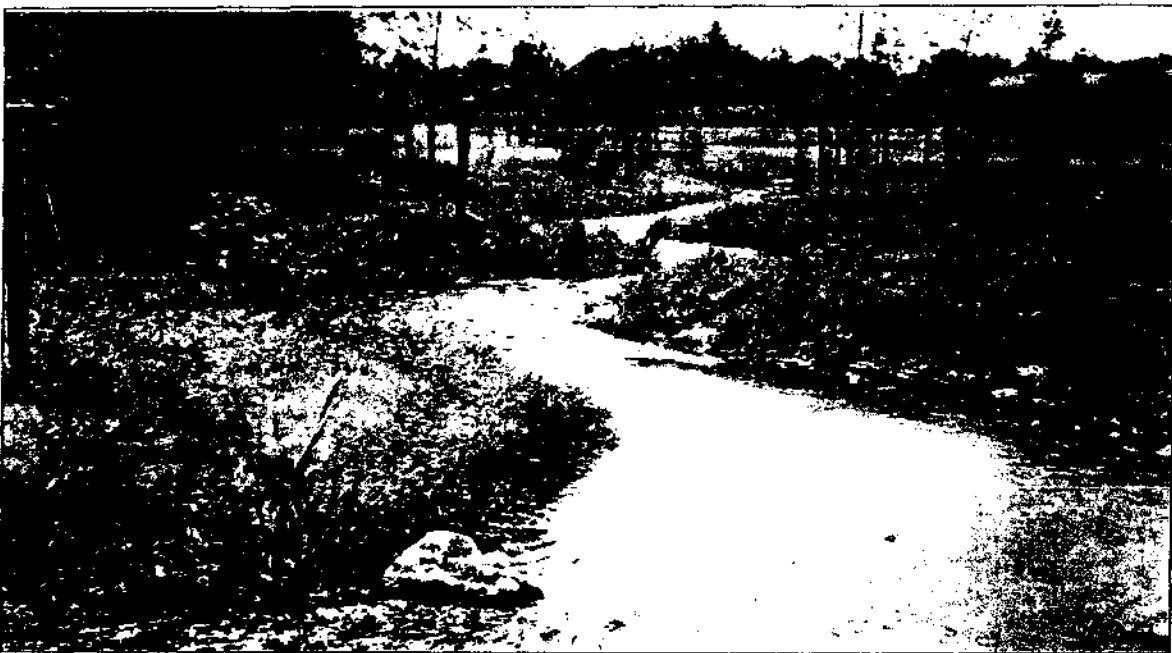
Bsp. einer erfolgreichen Renaturierung an Fließgewässern: Die Rodau im Regionalpark Obertshausen

Vorbeugender Hochwasserschutz durch eine Verlängerung der Laufstrecke mit Ausbildung eines mäandrierenden Bachbettes, Rückhalteflächen (Retentionsflächen) in Form von Geländemulden.