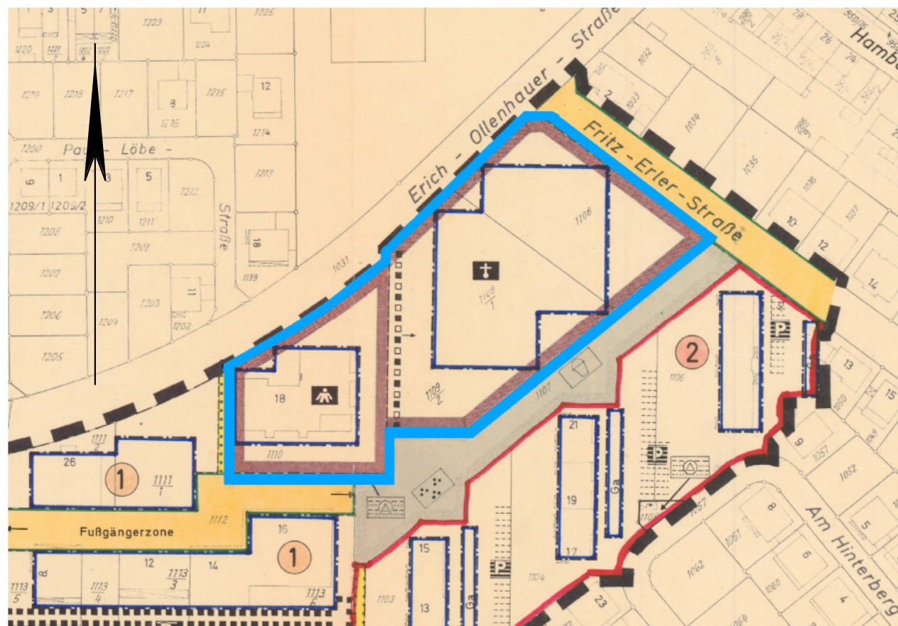
Ausschnitt aus dem Bebauungsplan Nr. 126 mit farblicher Darstellung des aufzuhebenden Bereiches