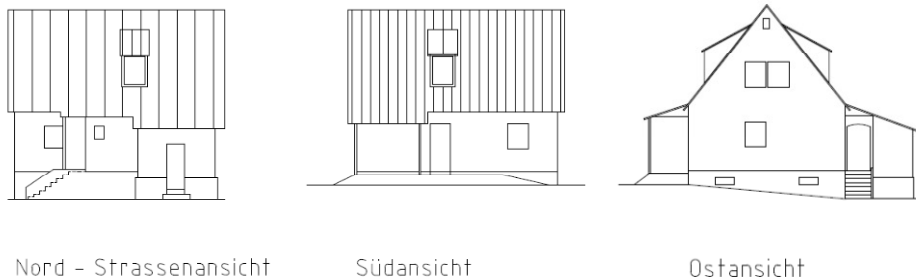
Abbildung 3: Ansichten Haus Nothelfer, ohne Maßstab

Das Haus hat eine Grundfläche von 61m 2 und eine Wohnfläche von etwa 80 m 2 .