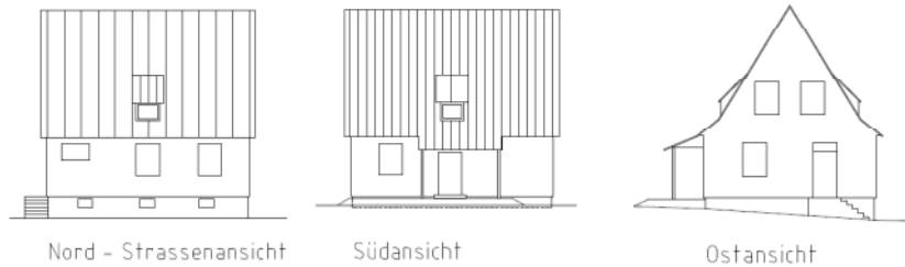
Abbildung 4: Ansichten Haus Lips, ohne Maßstab

Montagehaus in Skelettbauweise mit Stülpchalung als Außenbekleidung auf massivem Kellergeschoss. Die Skelettgefache sind zur Wärmedämmung mit Holzfaserdämmplatten ausgefüllt. Der Haustyp wurde von einem Zimmermeister aus Freiburg im Breisgau konstruiert. Die Grundfläche des Hauses beträgt 78 m 2 , die Wohnfläche etwa 110 m 2 .