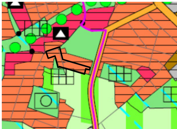
Abbildung 1: Entwurf RegFNP

Der Regionale Flächennutzungsplan verknüpft als neues Planungsinstrument des Regionalverbandes Frankfurt / Rhein-Main die Aussagen des Regionalplans und des Flächennutzungsplans im Verbandsgebiet. Der Regionale Flächennutzungsplan wurde mit Bekanntmachung am 17.10.2011 rechtskräftig. Im Regionalen Flächennutzungsplan 2010 ist die Fläche innerhalb des Geltungsbereichs als „Wohnbaufläche Bestand“ dargestellt. Der nördlich angrenzende Teil des Vorderwaldes ist als Grünfläche eingetragen, der südlich als Waldfläche und regional bedeutender Grünzug.