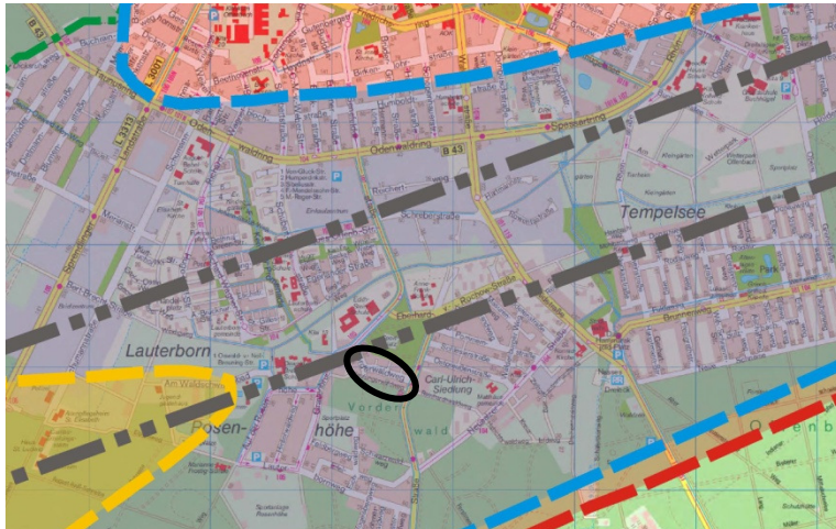
Abbildung 2: Fluglärmschutzzonen

Das Plangebiet liegt in der Tag-Schutzzone 2 des Flughafens Frankfurt, außerdem in der Nachtschutzzone und im Siedlungsbeschränkungsgebiet.