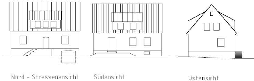
Abbildung 6: Ansichten Haus Sybille, ohne Maßstab

Die Grundfläche des Hauses beträgt 90 m 2 , die Wohnfläche etwa 130 m 2 .