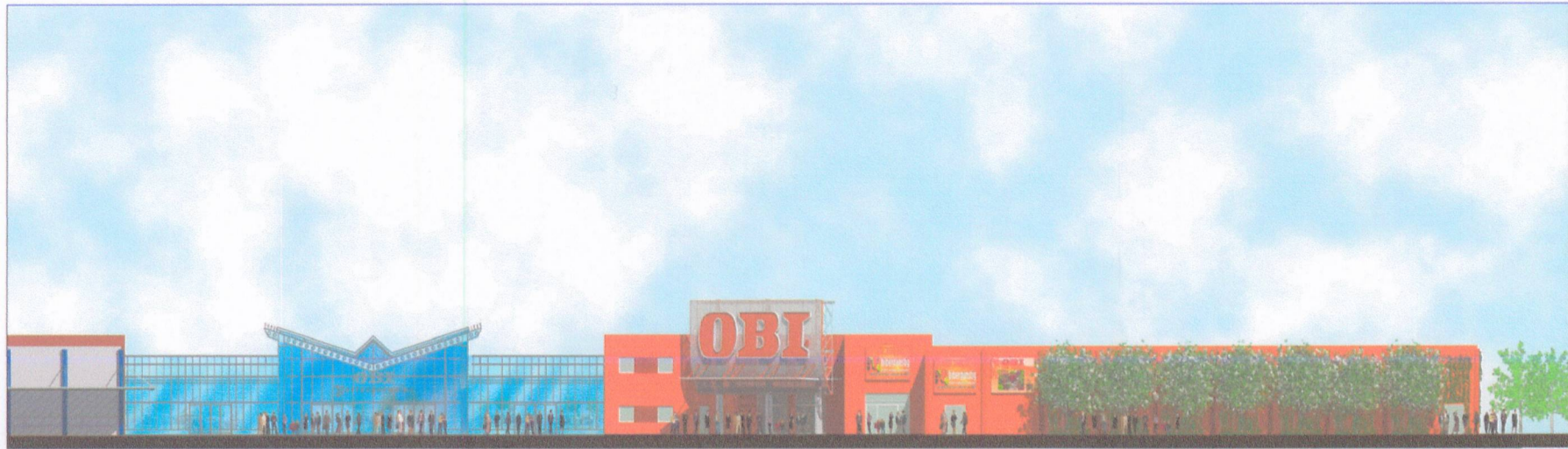
ANSICHT 1 Bau- und Heimwerkermarkt