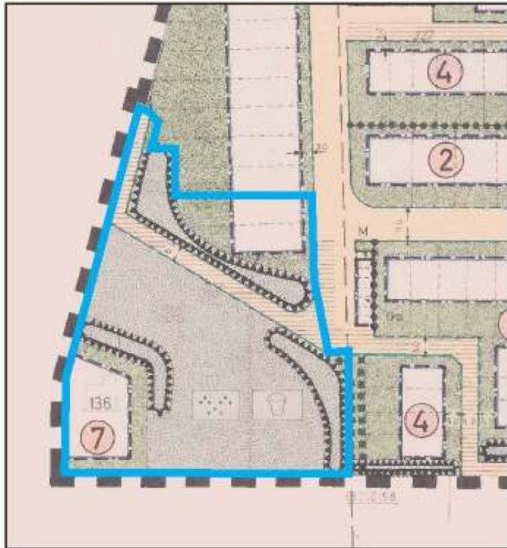
Ausschnitt aus dem Bebauungsplan Nr. 129 mit farblicher Darstellung des aufzuhebenden Bereiches auf der Grundlage der aktuellen Flurstückssituation.

Anlage zur Mag.-Vorl. Nr.: ..... unmaßstäbliche Verkleinerung