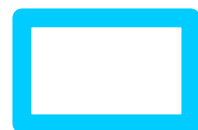
Umgrenzung des aufzuhebenden Teilbereiches