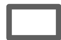
Umgrenzung des aufzuhebenden Teilbereiches

Die Festsetzungen des Bebauungsplanes Nr. 129 werden für die Grundstücke mit der Katasterbezeichnung Gemarkung Bieber, Flur 6, Flurstücke Nr. 1091/1, 1091/4 und Flur 13, Flurstücke Nr. 227/13, 227/14 und 227/15 aufgehoben.