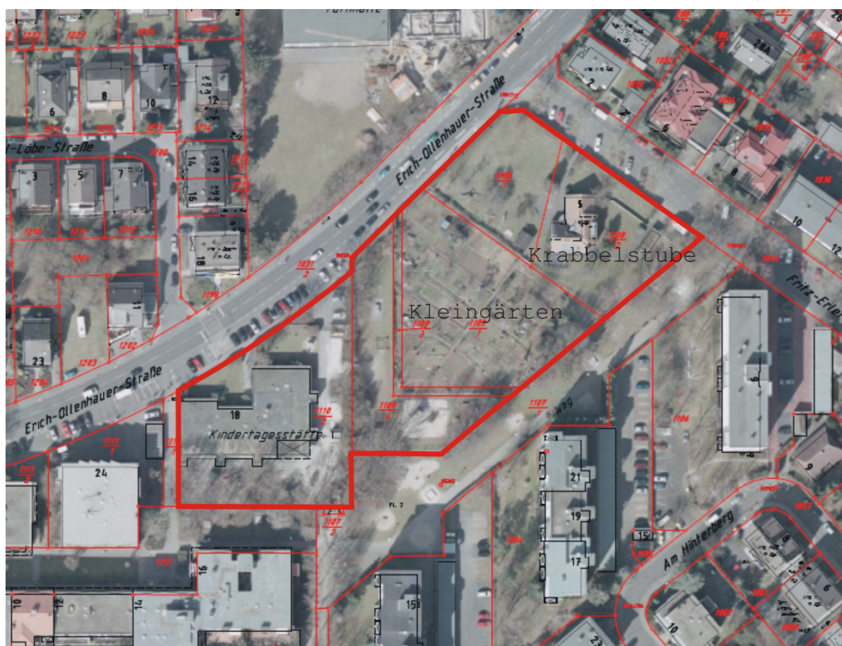
Luftbild vom Plangebiet