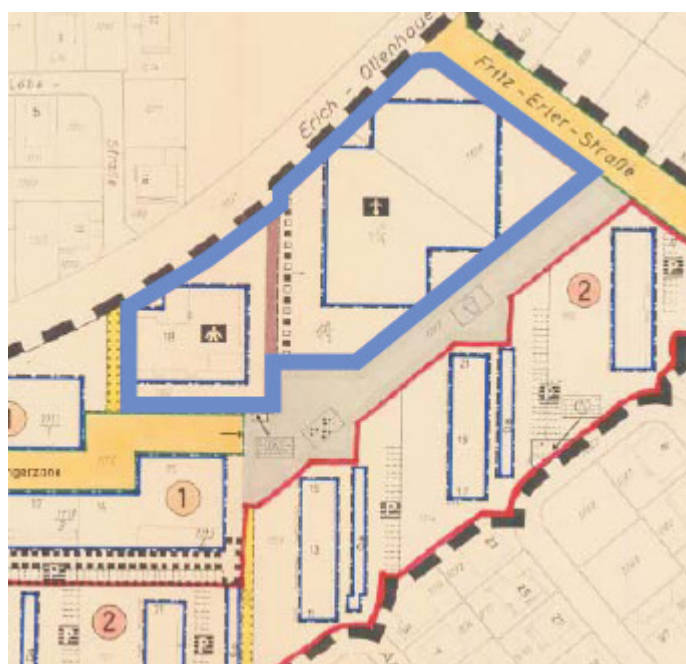
Ausschnitt aus dem Bebauungsplan Nr. 126 mit farblicher Darstellung des aufzuhebenden Bereichs