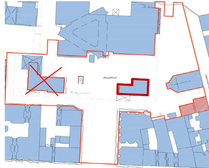
2. Erhalt des Cafe-Pavillions, unter Beibehaltung der derzeitigen Nutzung, Verschiebung einer energetischen Sanierung auf unbestimmte Zeit, ersatzloser Abriß des Polizeipavillions