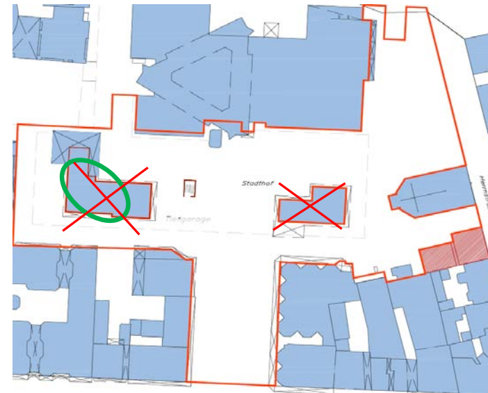
4. Abriß beider Pavillions, Schließung der Grundfläche mit Pflaster incl. Beleucht., Möblierg. etc., Neubau Cafe-Pavillion