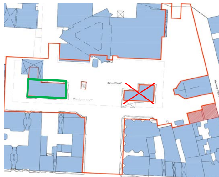
3. Teilerhalt des Polizei-Pavillions, Abriß nördl. Teil zum Platz der Deutschen Einheit, Umbau für Cafe-Nutzung, bautechnische und energet. Komplettsanierung, ersatzloser Abriß des Cafe-Pavillions