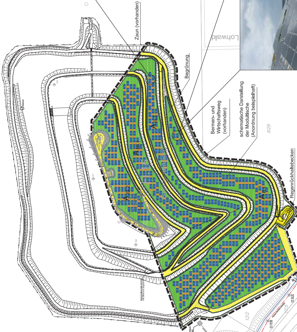
schematische Darstellung der Modultische (Anordnung beispielhaft)