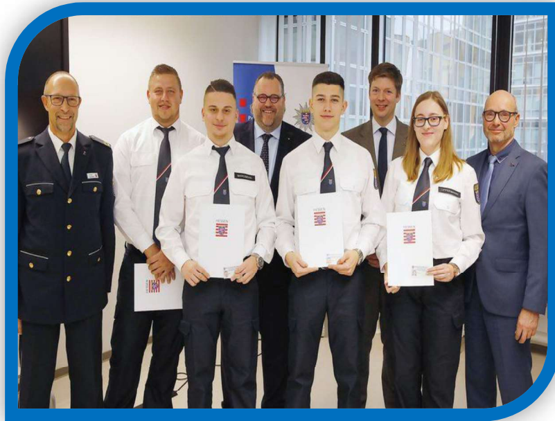
Inndienststellung von 4 Freiwilligen Polizeihelfern im Dezember 2019