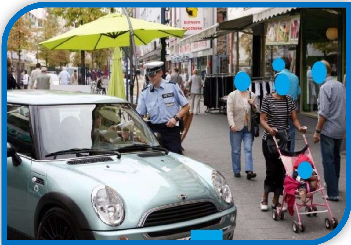
Verkehrsüberwachung in der Fußgängerzone

Zur Erhöhung der Verkehrssicherheit- und Leichtigkeit durch die Verkehrsüberwachung im ruhenden Verkehr, wurde im laufenden Jahr die Anzahl von 8 auf 10 Mitarbeiter(innen) der Firma „Securitas“ erhöht. Ob fehlende Sichtverhältnisse für Schulkinder an Fußgängerüberwegen, zugeparkte Gehwege und Radfahrstreifen, blockierte Schwerbehindertenparkplätze oder gar Rettungswege, welche durch parkende Fahrzeuge völlig zugestellt sind. Hier helfen oftmals eine Geldbuße oder in schlimmeren Fällen eine Abschleppmaßnahme doch mehr als ermahnende höfliche Worte. Auch bei der Überwachung des fließenden Verkehrs hat sich 2019 einiges getan. So wurden alle Stadtpolizistinnen- und Polizisten auf ein mobiles Überwachungssystem geschult und werden zukünftig die Kollegen der mobilen Verkehrsüberwachung beim Ordnungsamt unterstützen. Die erhöhten Messerfolge der mobilen städtischen Verkehrsüberwachung durch die Stadtpolizei sind bereits in der folgenden Statistik erkennbar.