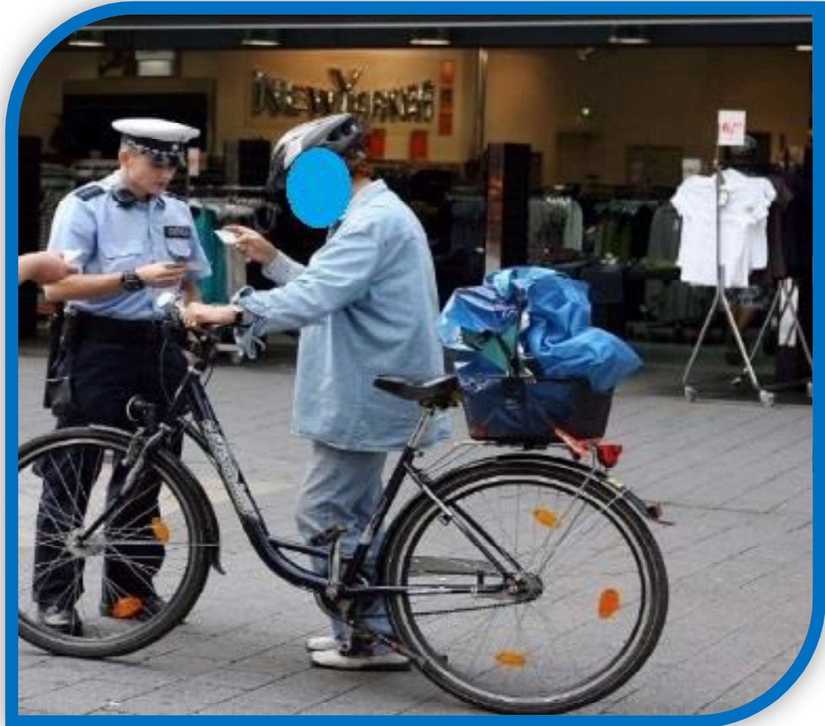
Kontrollaktion in der Fußgängerzone

Ein weiteres Augenmerk sind diverse Fahrradkontrolltage. Hierbei wird nicht nur darauf geachtet, dass sich Fahrradfahrer an die geltenden Regeln halten, sondern auch das Fahrrad selbst straßenverkehrstauglich ist.