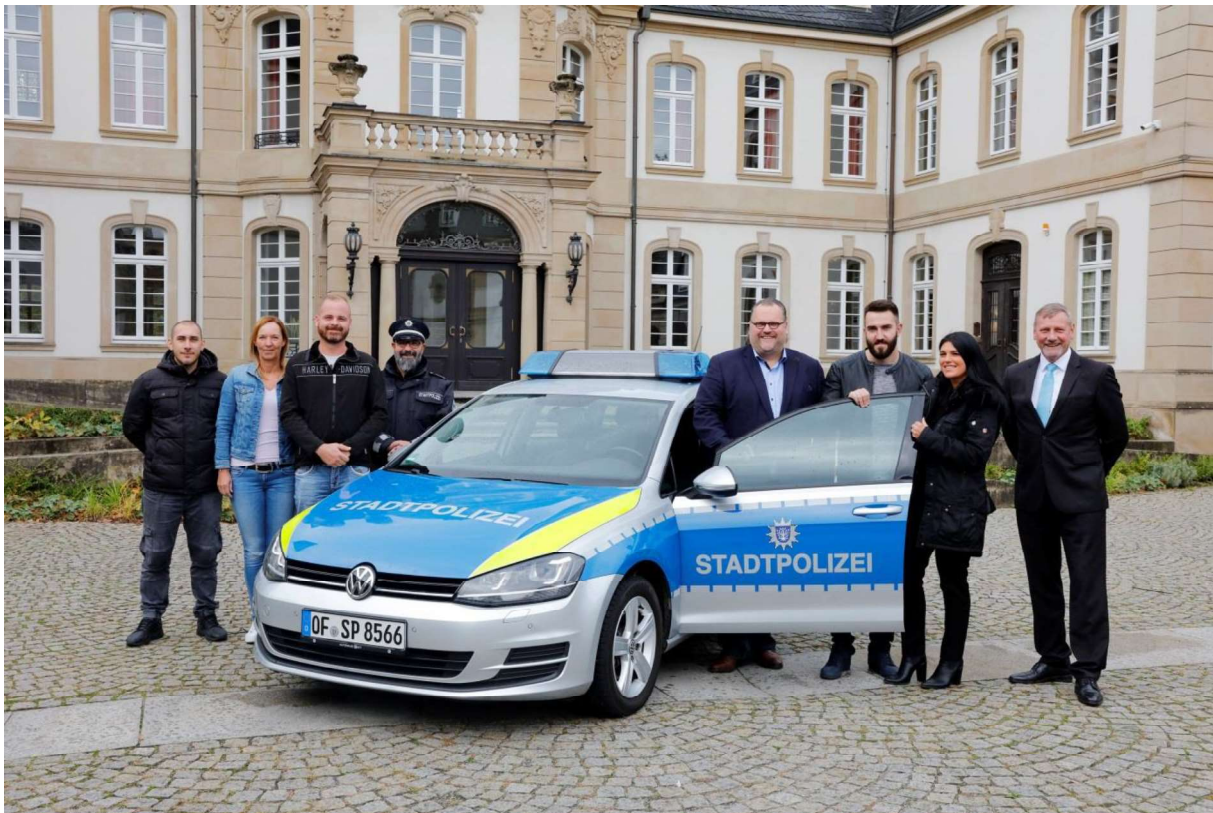
Indienststellung von 5 neuen Stadtpolizeibeamtinnen- und Beamten im Oktober 2019