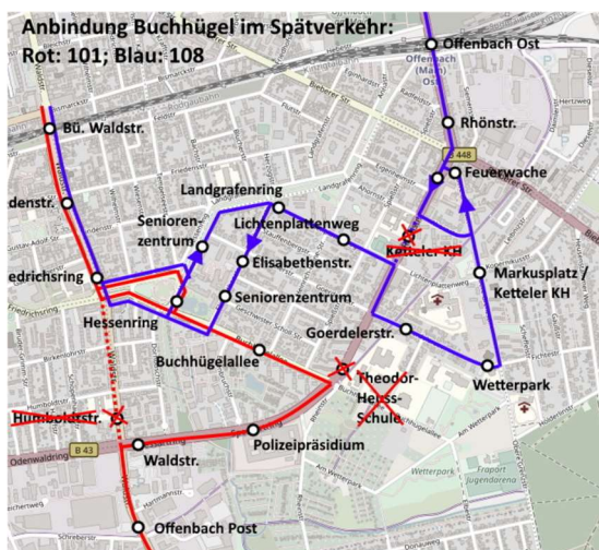
Abb. 1: Linienwege im Buchhügel im Spätverkehr (101, 108)