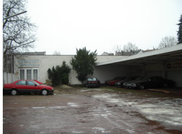
versiegelter Innenhof Bieberer Straße