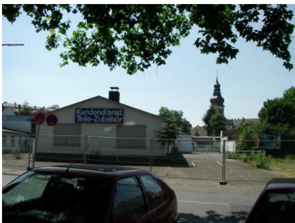
Brache des ehemaligen „Friedelgeländes“

Entlang der Mathildenstraße und der nördlichen Gerberstraße ist die Blockrandstruktur und die Maßstäblichkeit der Bebauung gestört: Die vereinzelt (drei) noch vorhandenen historischen Gebäude präsentieren sich in teilweise schlechtem Zustand. Mit der an sie anschließenden Brache, eingeschossigen Gewerbebauten und dem Baukörper der Mathildenschule ist das städtebauliche Ensemble von Brüchen bestimmt und das Stadtbild in desolatem Zustand.