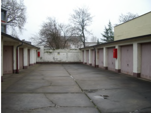
Garagenhof Bieberer Straße

Der Blockinnenbereich im südlichen Planungsgebiet ist kleinteilig parzelliert und dicht mit teilweise leerstehenden- Nebengebäuden und Garagen überbaut. Zahlreiche Grundstücke sind vollständig versiegelt, nur einzelne Grundstücke weisen gärtnerisch gestaltete Freiflächen auf.